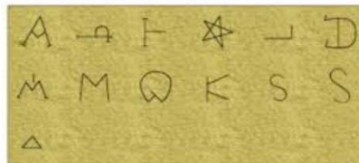
IGLESIA DE SAN TIRSO (y XI) SAHAGÚN (LEÓN), ESPAÑA Grupo de Markas de la Iglesia

La iglesia de San Tirso de Sahagún (León) es un edificio religioso construido en el XII. Es el edificio más representativo del arte románico-mudéjar leonés. Se han edificado en sus piedras 14 marcas de 11 tipos diferentes situadas en el interior del ábside.