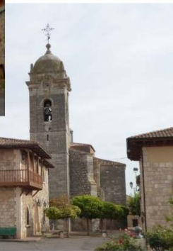
Iglesia de Santa Marina