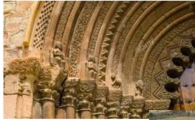
Iglesia de Ciraqui