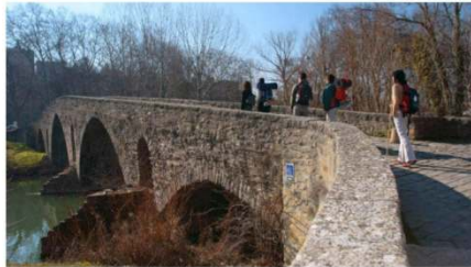
Puente de la Magdalena

La llegada a Pamplona se hace por el río Arga a través de su puente medieval de la Magdalena.