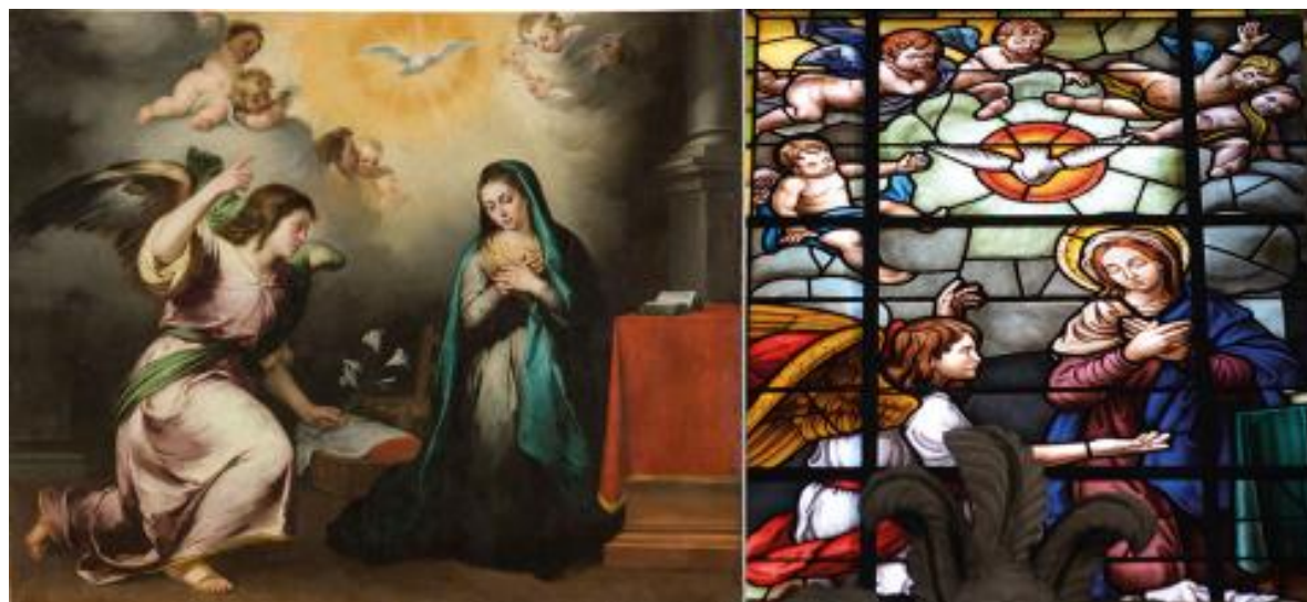
Basilica y Real Santuario de Santa María de la Victoria. Vidriera de la Anunciación.