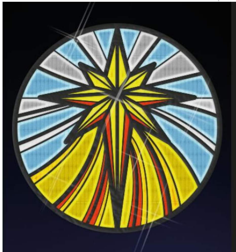
DISEÑO MEDALLÓN: ADORACIÓN DE LOS PASTORES y ESTRELLA DE ORIENTE.