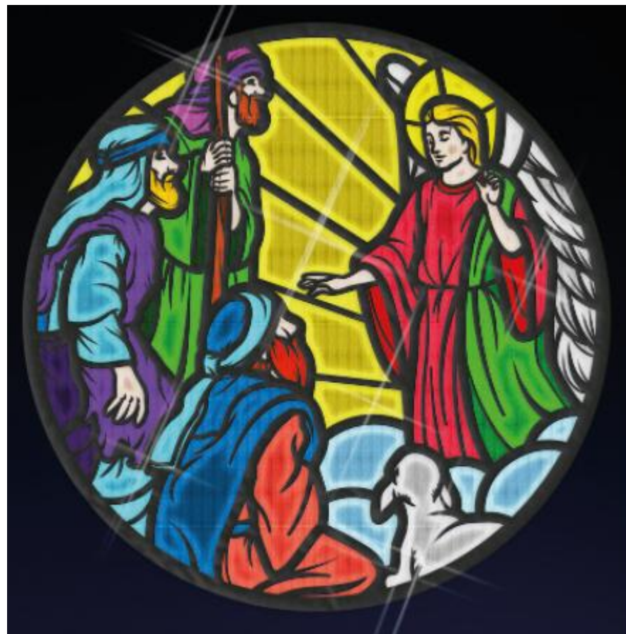
DISEÑO MEDALLÓN: MISTERIO DEL NACIMIENTO Y ANUNCIO A LOS PASTORES.