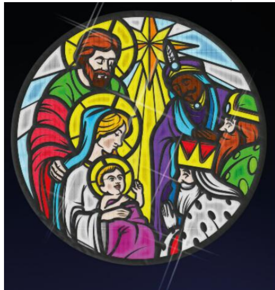
DISEÑO MEDALLÓN: CARAVANA REYES y ADORACIÓN REYES MAGOS (EPIFANÍA). Material gráfico cedido por Ximenez Iluminación (Dto. Comercial)