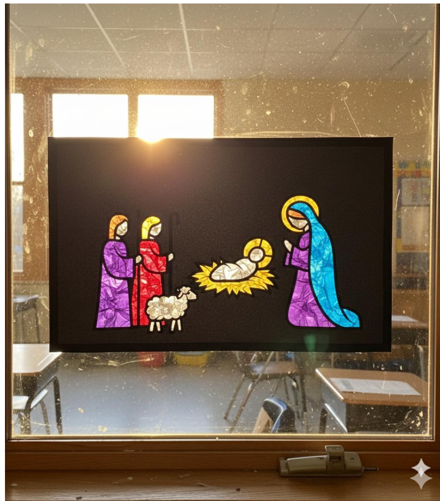
EJEMPLO VISUAL SIMPLIFICACIÓN ESCENA ADORACIÓN DE LOS PASTORES. IMAGEN DISEÑADA POR INTELIGENCIA ARTIFICIAL