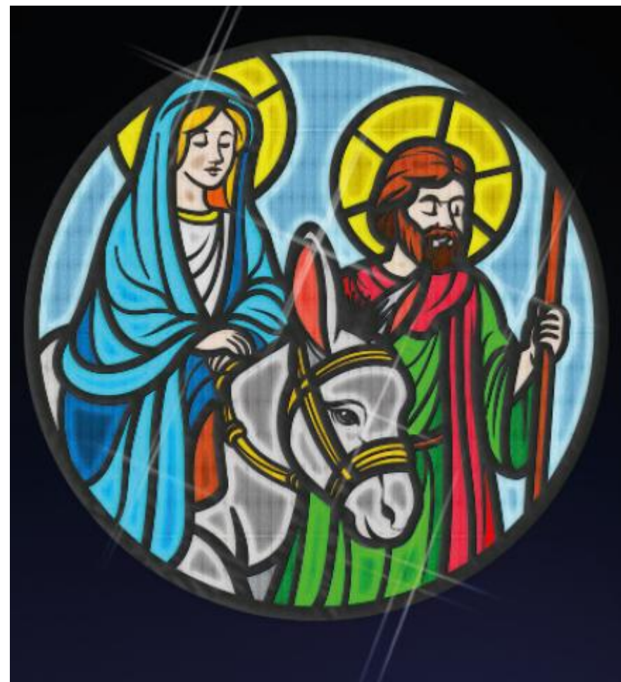
DISEÑO MEDALLÓN: ANUNCIACIÓN y CAMINO A BELÉN.